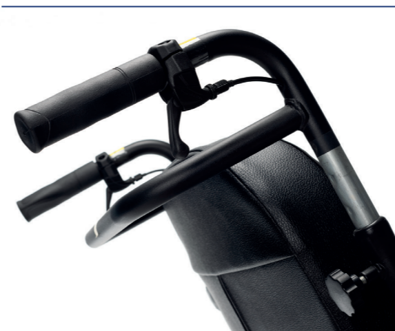
Regulacja wysokości rączek do pchania