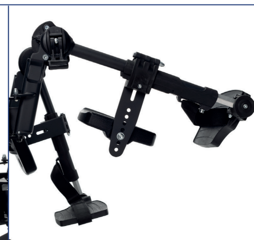
Regulowany kąt nachylenia podnóżków. Regulowany kąt płyty pod stopę. Regulowane podparcie pod tyłkę