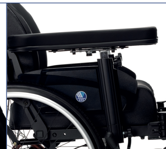
Super komfortowe podłokietniki z regulacją wysokości i głębokości. Regulowana głębokość siedzenia